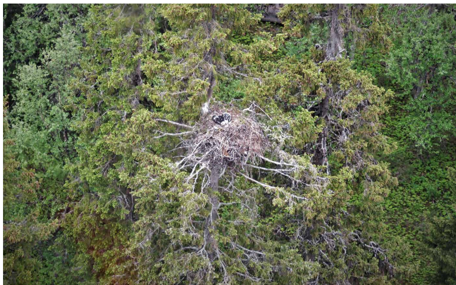
Foto från helikopterinventering i Västerbottens fjällområde 2019. Bilder från helikopter blir ofta något suddiga, men det brukar gå att fastställa antal och ålder när det finns ungar i boet.

I områden där spelflyktsinventering indikerat en boplats görs eftersök av bon. I början av juni kan vita ungar ses i bon mot den gröna skogen. Om det finns misstankar om att örnar har boplats i en sluttning eller ett stup kan man med fördel spana med kikare eller tubkikare mot berget för att se om man kan upptäcka vita ungar eller vit spillning i boet. Själva boet kan också börja lysa brunt eller orange när de tallkvistar som det byggts av vissnat och barren gulnat. Om boet inte kan hittas på avstånd genomförs inventering till fots. Skallgångskedja med flera inventerare är effektivast. Avståndet i kedjan får inte vara längre än att varje trädtopp kan ses. I tät skog måste man alltså gå mycket närmare varandra än i gles skog. Bon i gran kan vara mycket svåra att se och man kan behöva studera träden från olika vinklar. Ett bebott bo kan även hittas genom tiggande ungar som hörs på relativt långt avstånd. Ett bebott bo kan också indikeras av spillning eller omotiverade kvisthögar på marken. Även styckningsplatser kan hittas i närheten av bon och bytesrester kan avslöjas på lukten.