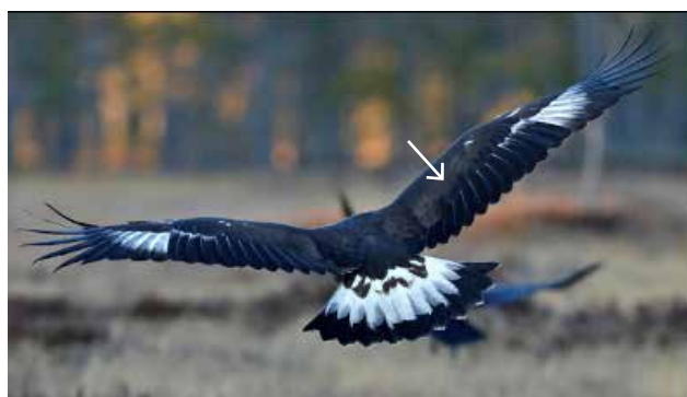
Flygg unge , täckarfälten på vingarnas ovsida är enhetligt mörka.