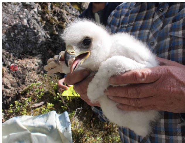
Unge <30 dagar , inga svarta vingpennor har brutit igenom.