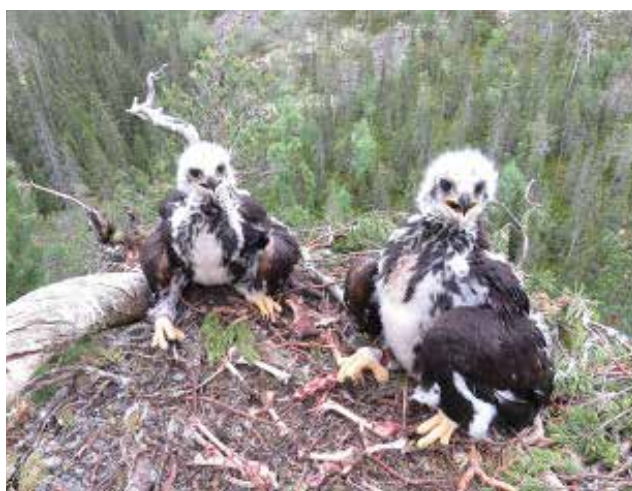
Ungar 30–50 dagar , mörka fjädrar har brutit igenom, men hjässorna är övervägande vita.