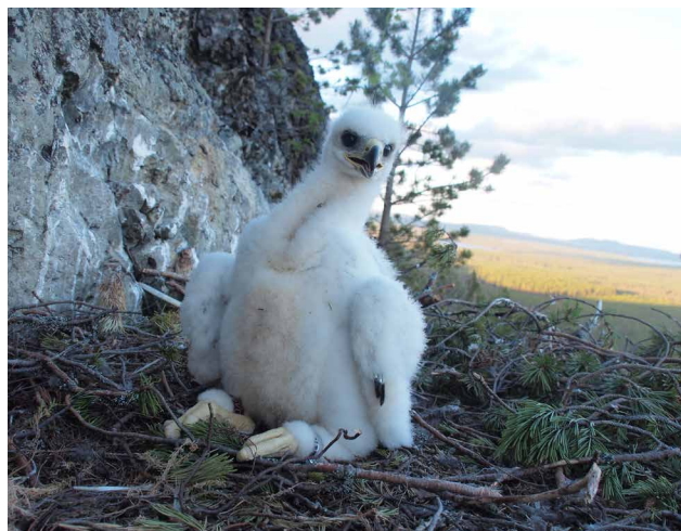
Unge ungefär 30 dagar , de första svarta vingpennorna har brutit igenom.