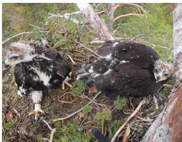
Ungar ungefär 50 dagar , lika mycket brunt som vitt på hjässorna.