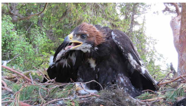
Unge >50 dagar , mer brunt än vitt på hjässan, ej flygg.