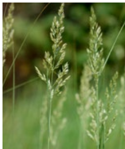
rörflen, bra val