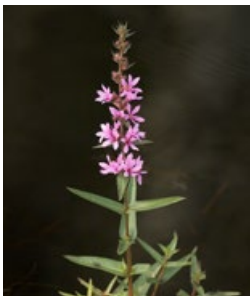
fackelblomster, bra val

Alternativ ur vår egen flora är hornsärv ( Ceratophyllum demersum ), kransslinga ( Myriophyllum verticillatum ), gäddnate ( Potamogeton natans ), gräsnate ( Potamogeton gramineus ), grovnate ( Potamogeton lucens ), vattenmöja ( Ranunculus aquatilis ), sköldmöja ( Ranunculus peltatus ), vattenblink ( Hottonia palustris ) och vattenbläddra ( Utricularia vulgaris ).