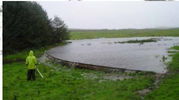
• Bilden från bilden till vänster efter kraftig regn.