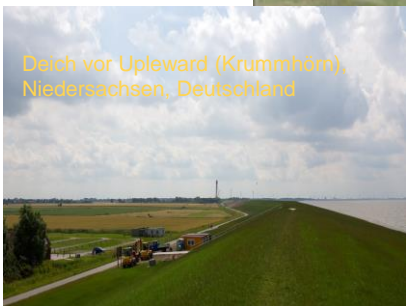
Deich vor Upleward (Krummhörn), Niedersachsen, Deutschland