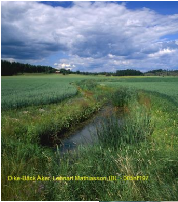
Dike-Bäck Åker, Lehnart Mathiasson, JBL - 005nf167

Tillståndet avser en vattenanläggning - inte en verksamhet