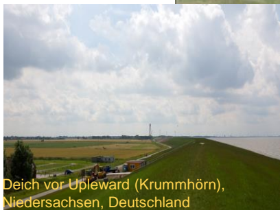
Deich vor Upleward (Krummhörn), Niedersachsen, Deutschland