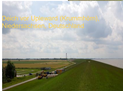
Deich vor Upleward (Krummhörn), Niedersachsen, Deutschland