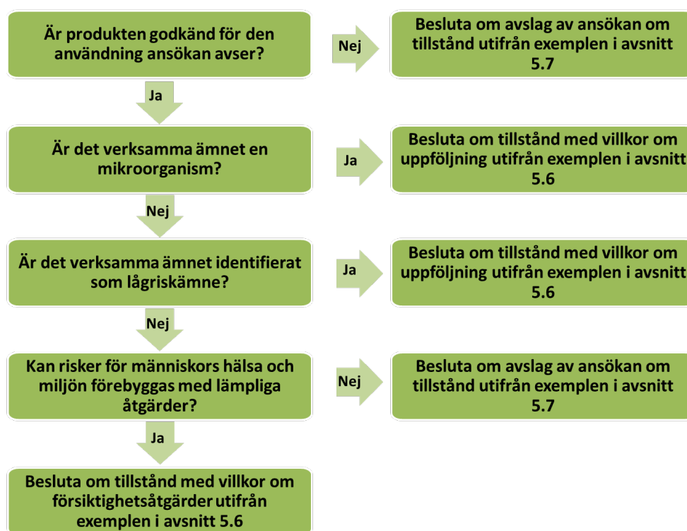
Figur 2. Beslutsschema för bedömning av en tillståndsansökan

Om det i det enskilda fallet har konstaterats att det inte finns rimliga alternativ till att använda växtskyddsmedel som omfattas av tillståndsplikt, kan nedanstående beslutschema fungera som stöd i den fortsatta prövningen.