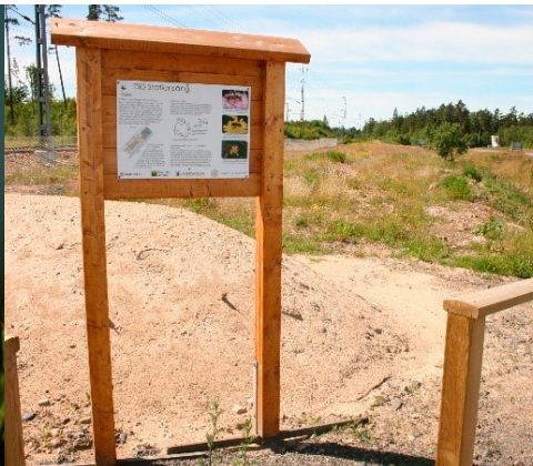
Bibädd vid Diö Stationsäng