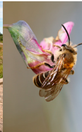
Vialsandbi i Hågadalen, Uppsala