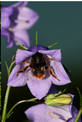
Blåkllocksbi i grustäkt