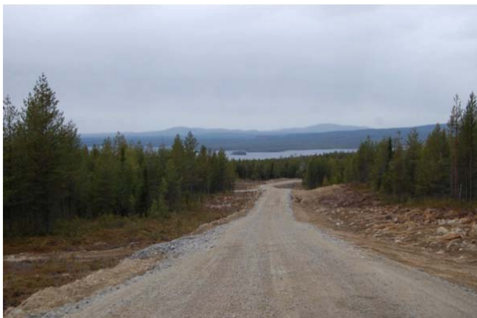
Ny väg i Storlidens vindkraftspark, Malå kommun.

Inom vindkraftsanläggningar skulle man kunna välja att sköta tillgängliga marker längs vägar och kraftledningar för att skapa extra föda och skydd åt växtätare, exempelvis genom att skapa och sköta busk- och gräsmarker och sluttande bryn. Sådan skötsel skulle kunna innebära ett icke försumbart tillskott av betesmark för klövvilt, och om klövviltpopulationerna samtidigt regleras genom jakt skulle det kunna innebära minskat betestryck i omgivande skogsmark. I detta sammanhang bör man dock varna för att marker rika på små däggdjur, kadaver av större växtätare etc. kan attrahera rovfåglar, vilka i sin tur löper risk att dödas av vindkraftverken.