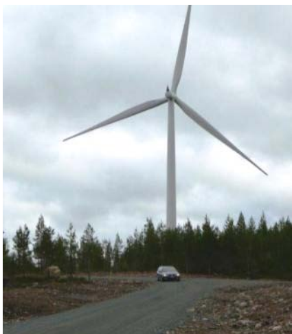
På de flesta håll är vägar inom vindparker tillgängliga för all trafik. Vindparken på Kyrkberget, Dalarna.

på att renarna undvek områden med skoterleder och området kring tätorten framförallt under senare delen av vintersäsongen och att hondjuren undvek området nära turistorten även under sommarhalvåret (Helle & Särkelä 1993, Anttonen m.fl. 2010).