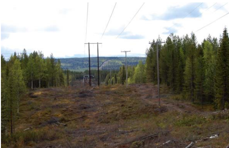
Ny kraftledning i anslutning till Jokkmokklidens vindkraftpark, Malå kommun. I bakgrunden syns även en ny kraftledningsgata till Storlidens vindkraftpark.

En del studier visar dock på att det inte finns ett sådant undvikande. Reimers m.fl. (2007) kunde inte se att vildrenarna valde bort områden runt en kraftledning. I den senare studien studerade man dock endast renar som var upp till 3 km från kraftledningarna, medan andra studier har konstaterat ett flertal gånger att renar väljer bort en zon upp till 4 km bort från större kraftledningar och istället väljer att uppehålla sig i områden 4–10 km bort från kraftledningarna (Nellemann m.fl. 2001, Vistnes & Nellemann 2001, Vistnes m.fl. 2004). En senare studie på renens habitatval inom 5 km från en kraftledning visade att de inte undvek området kring kraftledningen (Bergmo 2011). Lokala studier av renars beteende i närheten av kraftledningar (Flydal m.fl.