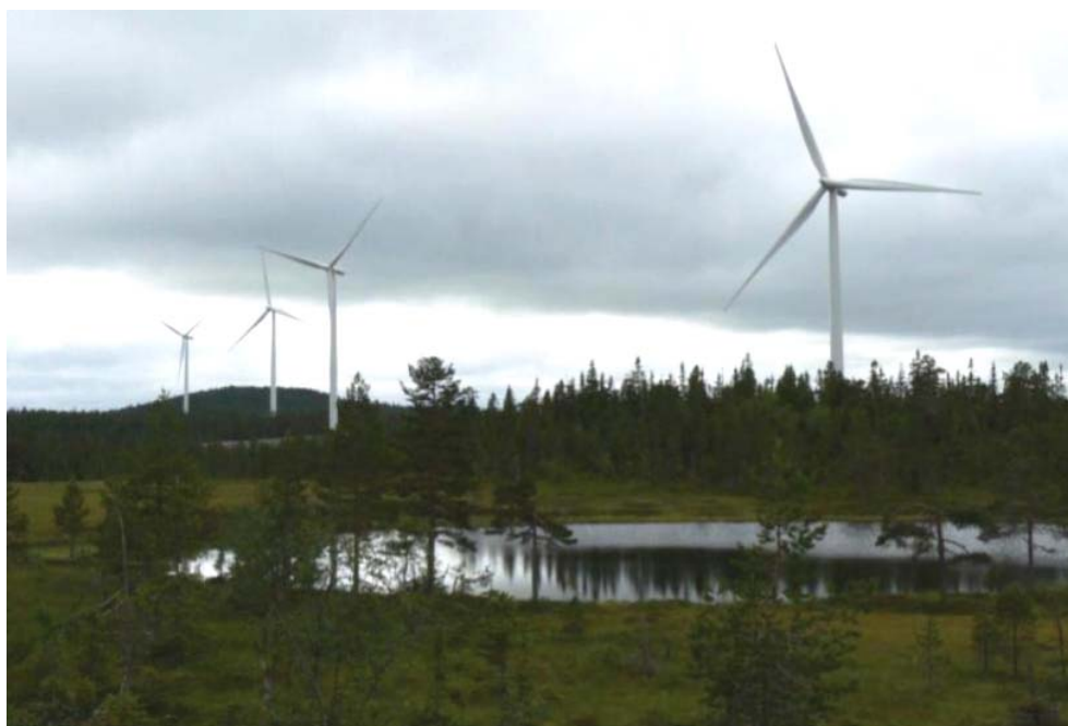
Vindkraft på Kyrkberget i Dalarna.

Eftersom det är väl känt att däggdjur kan påverkas av olika typer av mänskliga störningar och exploatering är det rimligt att också vindkraften har effekter. I takt med den ökande utbyggnaden av landbaserad vindkraft dyker frågan om effekter på de landlevande däggdjuren upp allt oftare, bland jägare, naturvårdare och inte minst inom rennäringen. Handläggare av vindkrafts-ärenden får allt oftare hantera frågor om stora rovdjur, älg och annat jaktbart vilt, och i all vindkraftsetablering inom renbeteslanden är påverkan på renar och rennäring viktiga frågor. Här behövs kunskapsunderlag som stöd för avvägningar mellan olika intressen.