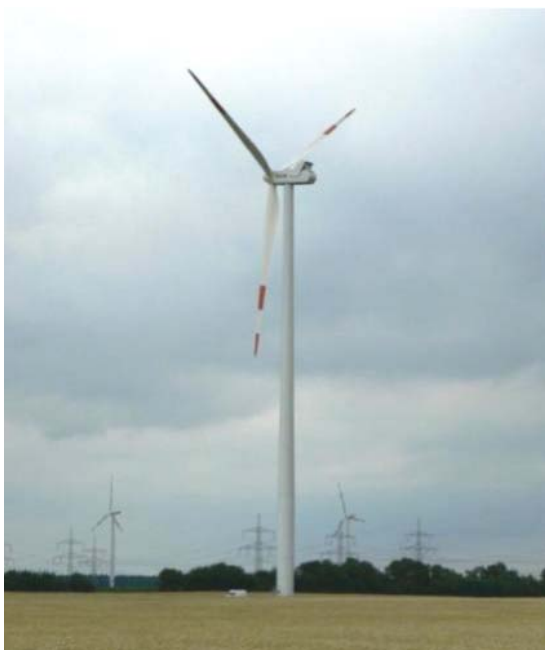
Vindpark vid Cottbus, Tyskland.

arter är också attraherade av vägnära habitat eller utnyttjar vägar för att lätt förflytta sig mellan områden (Nellemann & Cameron 1998, Bruggeman m.fl. 2007, Laurian m.fl. 2008, Martin m.fl. 2010, Ordiz m.fl. 2011). Det är alltså svårt att dra några generella slutsatser vad gäller det driftsrelaterade användandet av tillfartsvägarna.