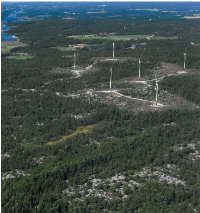
Vindkraft i bohusländska hällmarker. Foto Vägverket.