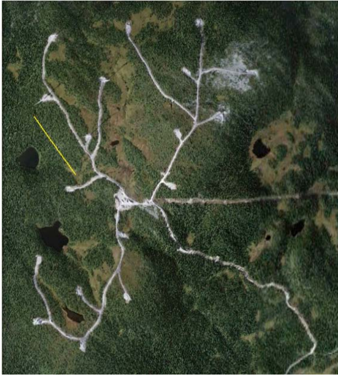
Vindparken i Bliekeväre, Västerbotten, där drygt 9 km ny väg byggts, och genomsnittlig vägområdesbredd uppmätts till 21 m (Rönnqvist 2011). Ett skalstreck på 500 m (gul linje) har lagts in. På bilden är vindparken under konstruktion.