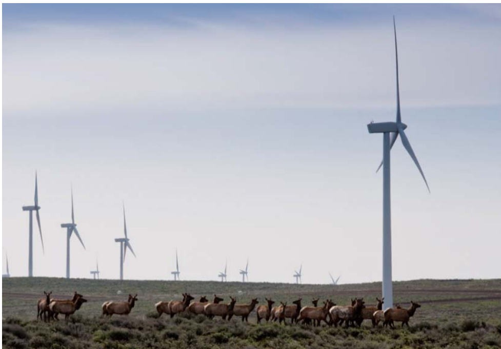
Kronhjortar vid en vindpark i Washington State, USA.

absolut. Enligt Arnett m.fl. (2007) kan ett undvikande under konstruktionsfasen förväntas även hos arter som åsnehjort, vitsvanshjort och gaffelantilop, men detta förblir alltså än så länge en spekulatio