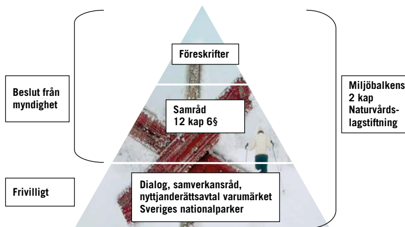
Figur 2. Miljöhänsyn för organiserad friluftsverksamhet.

Den som ska organisera ett arrangemang i ett skyddat område ska sätta sig in i vad områdets föreskrifter reglerar och förstå vilken påverkan arrangemanget kan få utifrån markslitage, störningar av känsliga djur- och växtarter exempelvis om en grupp kommer att paddla i anslutning till ett fågelskyddsområde. Redan vid planering av ett arrangemang har organisatörer möjlighet att bedöma om verksamheten kan antas uppfylla miljöbalkens krav. För friluftsliv som sker på allemansrättslig grund gäller allmänna hänsynsregler. Föreskrifter för naturreservat och nationalparker kan ange friluftaktiviteter som kräver tillstånd, samråd eller dispenser. Exempel är stora grupper som vandrar, tävlingar eller events. Det kan också vara gruppens storlek som avgör om tillstånd krävs.