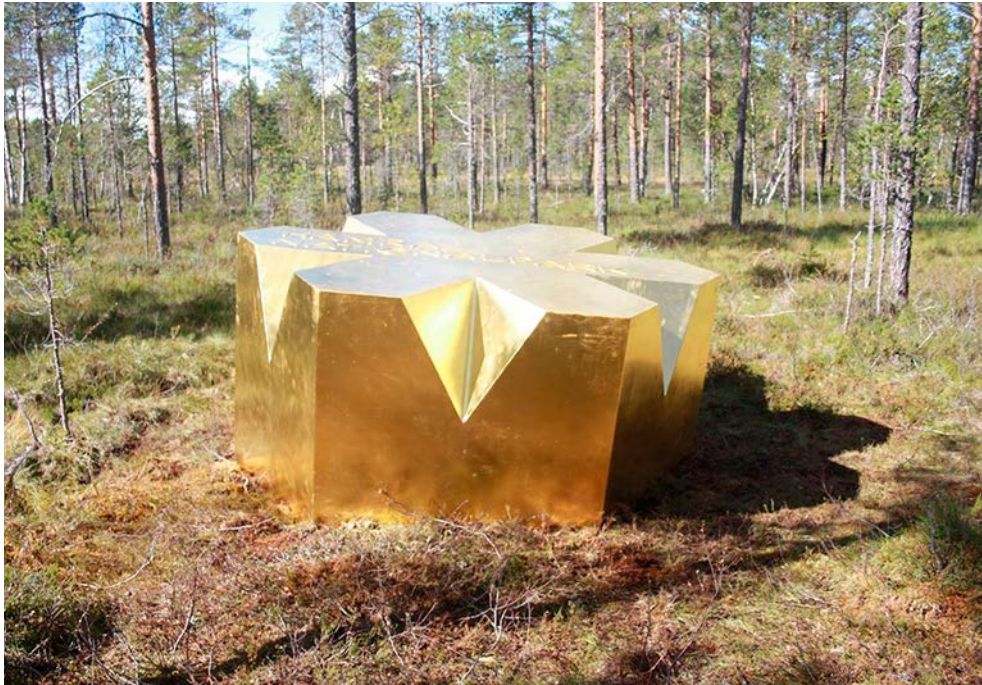
Guldstjärnan fungerar som en markör för Sveriges nationalparker. Här i Hamra nationalpark i Gävleborgs län.

För att teckna nyttjanderättsavtal för logotypen ”i samarbete med xx nationalpark” kontaktar organisatören förvaltaren för dialog om sin verksamhet. Förvaltaren gör en bedömning av friluftaktiviteten/verksamheten utifrån avtalets skrivningar, syftet med områdesskyddet och nationalparkens föreskrifter (läs mer 4.2, 5.1). Organisatören undertecknar därefter ett tidsbegränsat avtal för att få använda logotypen ”i samarbete med xx nationalpark”. Tillsynsmyndigheten eller förvaltaren, vanligen Länsstyrelsen, avgör om organisatören vidtar de åtgärder som behövs för att begränsa eller motverka skada på naturmiljö och för andra friluftsutövare i sin aktivitet/verksamhet i samband med nyttjande av logotypen (läs mer 9.5 del 2).