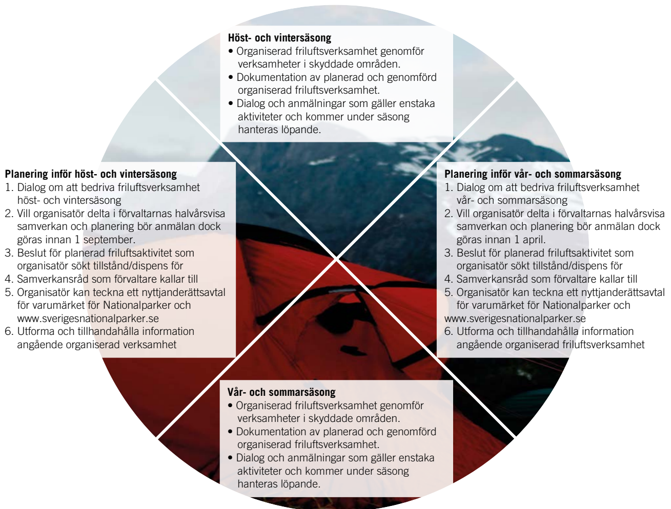
Figur 5. Årsplan för kommunikation, samverkan och dialog för organiserat friluftsliv.

Om verksamheten bedrivs i fjällterräng kan det exempelvis vara lämpligt att organisatören har kunskaper som motsvarar Fjällsäkerhetsrådets fjälledar-norm. Annan lagstiftning som produktsäkerhetslagen kan ställa krav på organisatör att bedriva ett aktivt förebyggande säkerhetsarbete i sin verksamhet. Det är ett krav som exempelvis STF som arrangerer själva ställer på sina guider som leder organiserade turer i de skyddade områdena i de fyra fjällänen Dalarna, Jämtland, Västerbotten och Norrbotten. 108