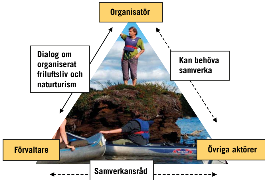
Figur 4. Process för organiserat friluftsliv och naturturism

och engagemang tas tillvara. Det är viktigt att dialog kommer igång i ett tidigt skede av en process både ur förvaltarens och organisatörens perspektiv. 95