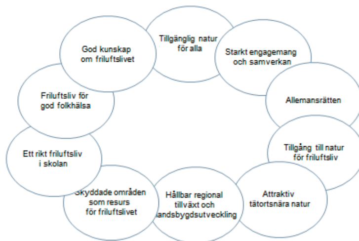
Figur 1. Friluftspolitikens tio mål. Friluftslivspolitikerna är breda och innehåller mål såväl tillväxt som folkhälsa, samverkan, forskning, skyddade områden och tillgänglighet.