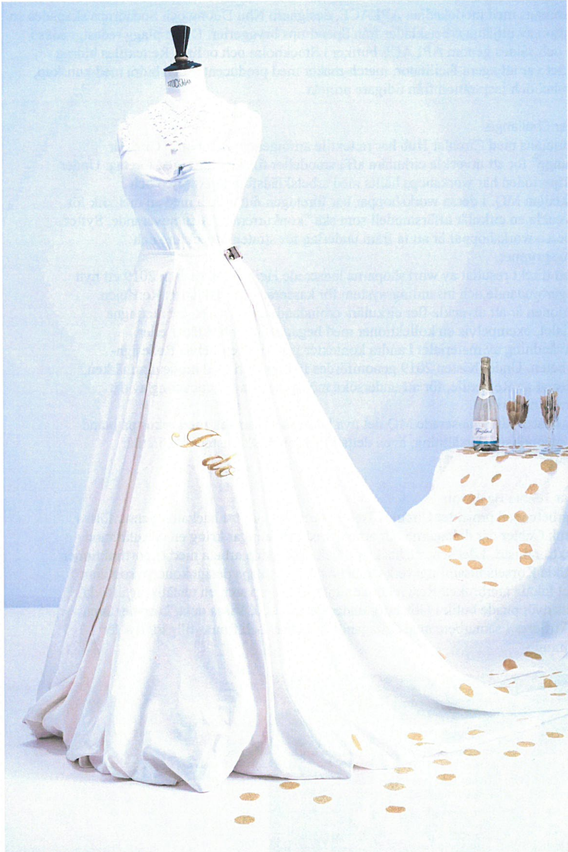
Bröllopsklänning av återbrukat material från Circular TExtile Hackaton