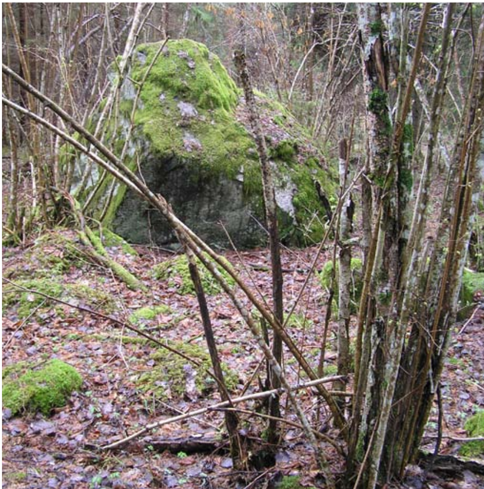
Figur 2. Lokal för rökpipsvamp. Fjällnora, Uppland.

markvatten är det naturligt att vatten ansamlas och bildar ett vattendrag. Det behöver med andra ord inte vara vattendraget i sig som ger den gynnsamma situationen. I centrala Uppland växer arten ofta i anslutning till underjordiska bäckflöden, så kallade glupar.