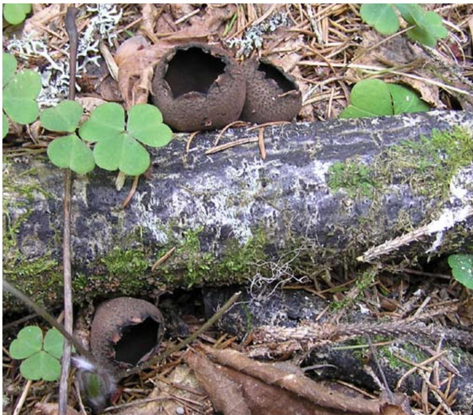
Fig 1. Urnula -förekomsten vid Gåsholmen, Björklinge, Uppland.

Arten hör till ordningen Pezizales , disksvamparna (tidigare Discomycetes ) inom den stora gruppen sporsäcksvampar ( Ascomycetales ). I knoppstadiet liknar fruktkroppen (apotheciet) en liten, päronformad röksvamp. Utsidan är luden av korta hår och brunaktig. I toppen finns ett litet mynningshål som under fruktmognaden spricker upp stjärnformigt och blottar det inre sporbärande skiktet, som till färgen är svartbrunt till nästan svart. Fruktkroppen blir slutligen urn- eller pokallik, vilket refererar till det vetenskapliga namnet Urnula och till artens amerikanska namn ”Devil’s urn”. Urnans kant är karaktäristisk genom att den är försedd med små utåtböjda-tillbakarullade tänder. Fruktkroppen är som fullt utvuxen ca 4-6 cm hög, i övre delen 2-3 cm bred samt mer eller mindre skaftad, i regel med ett 2-4 cm långt och 5-8 mm brett, ofta fårat skaft som utan gräns övergår i apotheciets övre del.