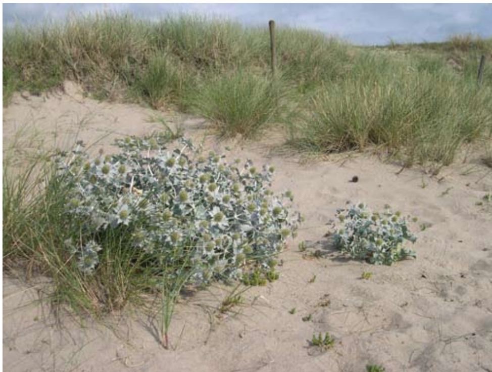
Bild 2. Martorn trivs främst i sandiga miljöer.