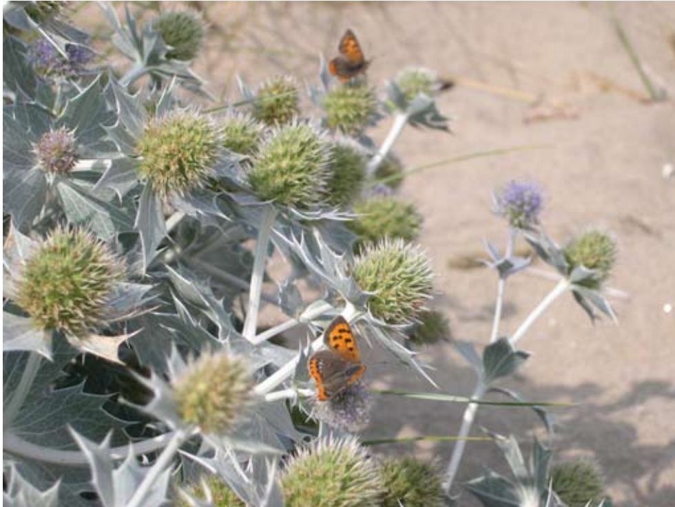
Bild 1. Martorn besöks flitigt av en lång rad insekter, bland annat dagfjärilar såsom mindre guldvinge Lycaena phlaeas .