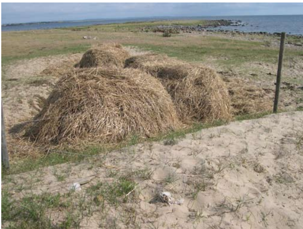
Bild 3. Utläggning av halm kan innebära en minskning av areal sandblottor och kan ha en negativ inverkan på martornets möjligheter till etablering av groddplantor.

lång tid men är på sikt dömda att gå under. Även sandbindande åtgärder som exempelvis utläggning av halm, ris eller liknande kan få likartade effekter. Invasion av främmande arter har uppmärksammats internationellt som ett möjligt problem. Man har bland annat i Portugal och Lettland sett att invaderande arter – Acacia longifolia i det portugisiska fallet (Marchante m.fl. 2003), vresros Rosa rugosa och Elaeagnus commutata i det lettiska fallet (Anonym 2005) – kan utgöra ett hot mot martorn och andra växter i dyn- och strandmiljöer. Det framgår inte av arbetena om en direkt påverkan på martornet kunnat detekteras. I Sverige har konkurrens från invaderande arter, främst vresros, noterats som en hotfaktor i Skåne. Invaderande arter har, liksom andra igenväxningsarter, en bindande effekt på sanden. Martornet växer i första hand i dynsystemens tidigaste successionsfaser eller i övergången mellan strand och dyn. Om stabiliserande faktorer minskar de tidigaste successionsfasernas utbredning i tid och rum kan detta därmed inverka negativt på martornets framtida överlevnad.