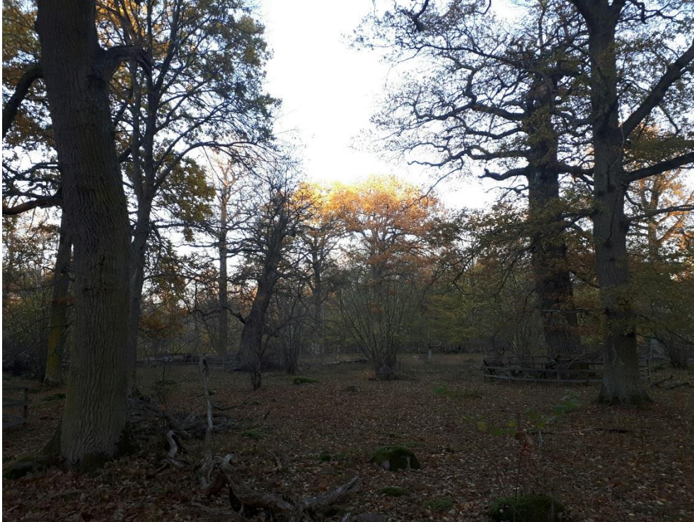
Halltorps hage.