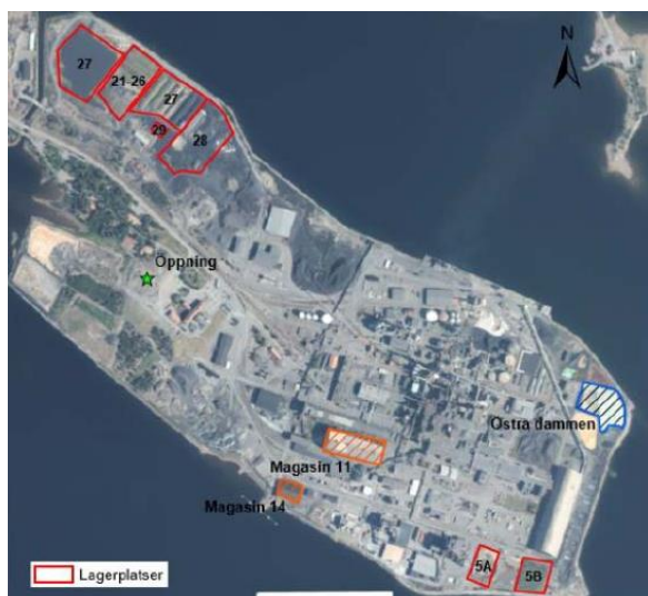
Bild 2. Lagerplatsernas lokalisering

Utöver det lagrade avfallet kommer även fallande avfall från Bolidens processer att deponeras i djupförvaret. Eftersom Boliden återför restprodukter till processerna i så hög utsträckning som möjligt rör det sig om fallande avfall som inte kan upp- arbetas inom eller utanför industriområdet.