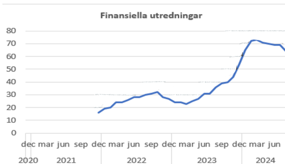
Figur 2 Finansiella utredningar

Projektet med dokumenterade ställningstaganden till behovet av finansiella utredningar kommer att fortgå tills vidare. Det bör under det kommande året 2025 kunna avläsas vilken effekt projektet har och om det kan antas bidra till en ökning av framställda yrkanden. Det är också för tidigt att nu redovisa framgångsfaktorer avseende arbetsmetoder och beräkning av brottsvinster.