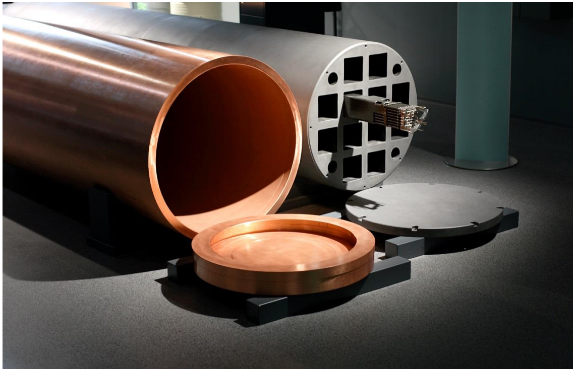
Bild 2. Insats och hölje för en slutförvaringskapsel. På bilden syns en kapsel för Olkiluoto 1 och 2, som mäter 1,05 meter i diameter och 4,8 meter på längden. Fennovoimas kapslar är något längre och har en annan typ av insats.

Med ”inkapslingsanläggning” avses en kärnanläggning där använt kärnbränsle kapslas in i slutförvaringskapslar. Slutförvaringskapseln är en massiv metallbehållare som består av en insats av gjutjärn och ett yttre hölje av koppar (Bild 2).