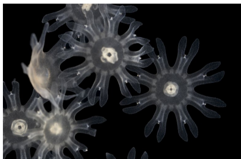
29.24 Bildnamn: 29.24_Nyknoppade oronmaneter_FredrikPleijel Motiv: Nyknoppade öronmaneter i Kosterfjorden