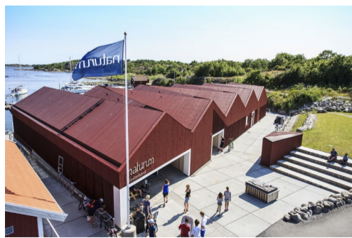
29.41 Bildnamn: 29.41_Naturum_Koster_Joh- ner_MattonCollection_matmc_jsn10050 Motiv: Naturum, Koster, Strömstad