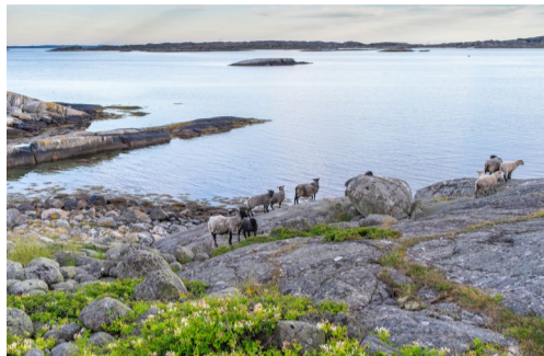
29.11 Bildnamn: 29.11_Far_Koster_Martin- Borg_IMGP9535 Motiv: Får, Koster