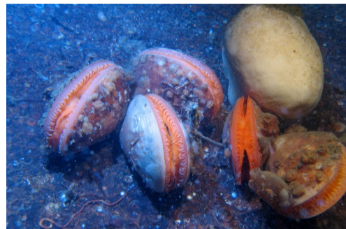
29.25 Bildnamn: 29.25_Lima_acea_Kosterhavet-TomasLundälv_hog Motiv: Bilden visar en djup klippvägg i centrala Kosterfjorden (SO Sydkoster) på ca 180 m djup med karaktärsarterna för denna miljö limamusslor och "fotbollssvamp". På bilden syns också flera arter sjöpongar och rörbyggande borstmaskar.