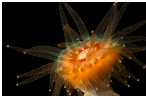
29.22 Bildnamn: 29.22_Bågarkorall_Fredrik- Pleijel Motiv: Bågarkorall i Kosterfjorden