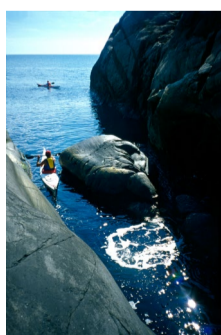
29.31 Bildnamn: 29.31_Kajaker_LadiKirn_ Alamy_IBL_25.A3JF8F Motiv: Kajaker vid Koster