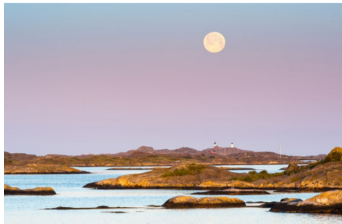
29.12 Bildnamn: 29.12_Kosterhavet_Martin- Borg_IMGP9639 Motiv: Kosterhavet