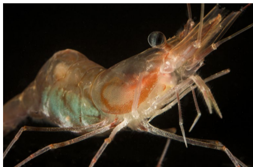
29.21 Bildnamn: 29.21_Nordhavsrika_ FredrikPleijel Motiv: Nordhavsrika i Kosterfjorden