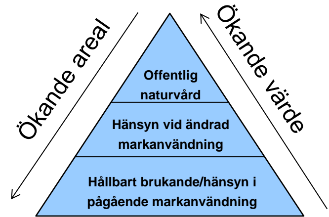
Modell för ansvarsfördelning i svensk naturvårdspolitik

6.6.4 Europeiska Havs- och Fiskerifonden