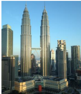
IPBES-4 (Feb 2016, Malaysia)