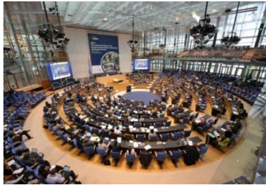
IPBES-1 (Jan 2013, Bonn)