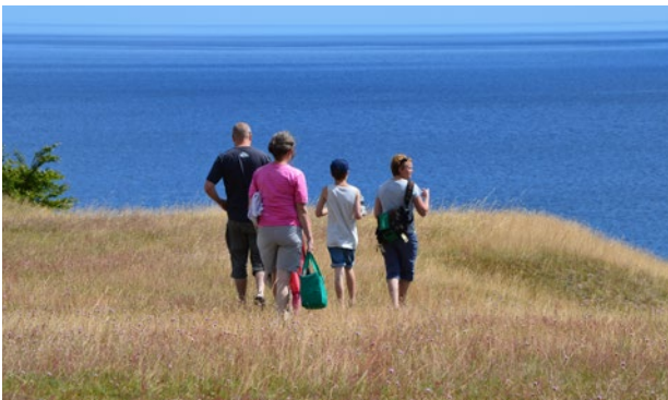
Ett av fallstudieområdena i projektet. Simrishamn: Vitemölla strandbackar