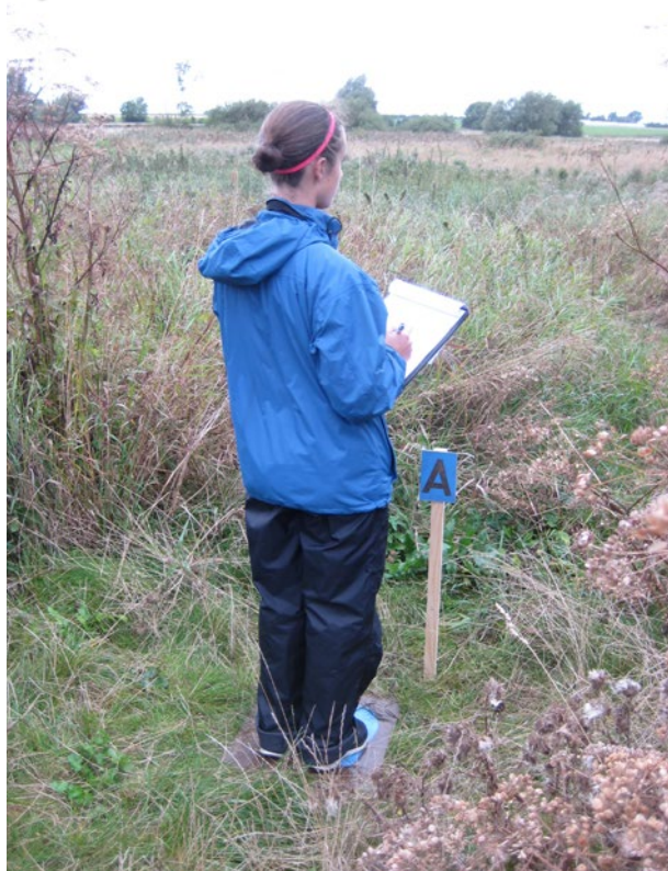
Bedömning på en av platserna inom ett våtmarksområde

Våtmarker valdes ut som studieobjekt för att de bidrar till biologisk mångfald och ett flertal ekosystemtjänster som exempelvis vattenrening, skydd mot översvämningar och vattenmagasinerings. Det har även tidigare visats att våtmarker i anslutning till bostadsområden anses bidra till människors välbefinnande genom möjligheter till