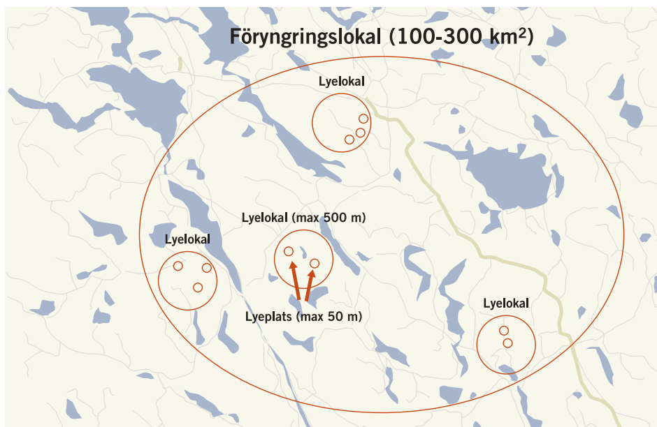
Figur 1. Illustration av viktiga begrepp som är centrala i metodiken för inventeringen av föryngringslokaler (se Järv: Instruktion för fastställande av föryngring.).

är för små för att följa henne. Järvhonan kan under lyeperioden skifta mellan olika lyor/lyeplatser (se figur 1). Ofta sker detta inom en lyelokal, men ibland förekommer längre förflyttningar inom föryngringslokalen till det som kan definieras som en ny lyelokal (Detta sker vanligtvis sent under säsongen). När lyan är placerad i snödrivor i fjällterräng är öppningen ofta bara ett litet anonymt hål med en diameter på 20–25 cm som går lodrätt ned vid till exempel en bergvägg, stenblock eller en trädstam. Längs bergväggar och stenblock skapas ofta naturliga hålrum i snön och dessa hålrum används ofta av järven när den gräver gångar i lyan. Därför är platser, med överhängande berg och stora stenblock, väl lämpade som lyor. När lyorna är placerade i snödrivor har de ofta välutvecklade gångsystem och flera liggplatser och ”toaletter”, där järven på ett eller flera ställen samlat lämnar sin avföring. Gångsystemens längd varierar mycket, från någon enstaka meter till över hundra meter långa gångar. Varierande de snö- och vindförhållanden mellan olika år är sannolikt en bidragande orsak till varför lyans utseende och placering inom en lyelokal varierar mellan år.